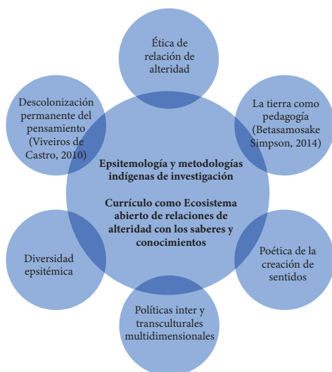
Figura 6. Boceto de relaciones entre componentes del currículo como ecosistema abierto de relaciones de alteridad con los saberes y el conocimiento (Elaboración en diálogo con las propuestas de Betamosake Simpson, 2014 y Viveiros de Castro, 2010).

Alterar la perspectiva podría considerarse como una finalidad diferente en educación que afectaría de igual manera la noción sobre el currículo, que se comprendería como un ecosistema de relaciones de alteridad, como se propone en el siguiente boceto de relaciones: