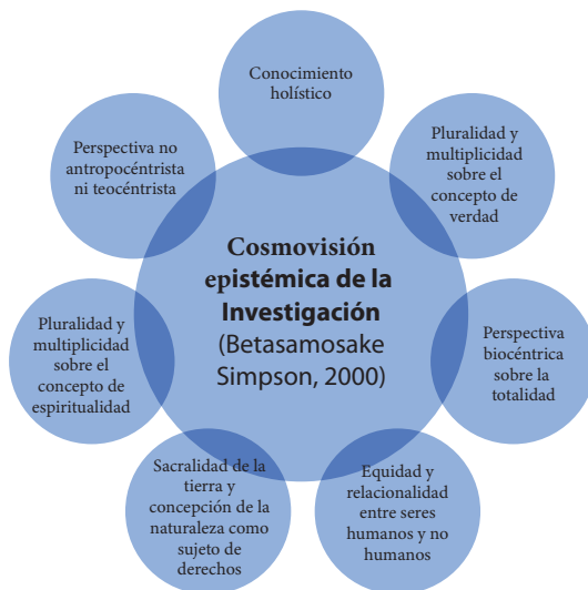
Figura 5. Boceto de principios de una cosmovisión epistémica de acuerdo a la propuesta de Betasamosake Simpson (2000)

Las concepciones epistémicas y metodológicas se establecen entonces a través de una relación con la poética y la estética que se transversalizan e intersecan en el espacio y tiempo holístico de la relación educativa/investigativa/creativa, que en correspondencia con la perspectiva de Leanne Betasamosake Simpson (2000), se relacionaría con los siguientes principios de la cosmovisión epistémica indígena de la investigación: