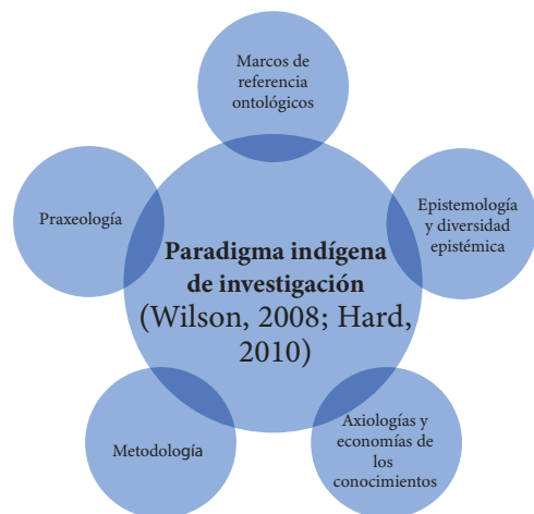
Figura 3. Boceto de elementos del Paradigma Indígena de investigación de acuerdo a la propuesta de Wilson (2001) y Hart (2010).

Los cuatro aspectos, componen un ecosistema de representación de la epistemología indígena en el que se propone un proceso de investigación que implica el conocimiento de sí mismo y los otros, es decir una ontología plural a través de una praxis dialógica con la cosmovisión como perspectiva abierta sobre la comprensión de la vida, en la que el saber y el conocimiento implican una ética y política de la investigación en relación dialógica con una poética y estética relacionales e inter especies (Tsing, 2005, 2017) que en la acción ceremonial-investigativa revela una praxis de relación de intimidad y exposición con los saberes, a través de la que es posible considerar las siguientes relaciones: