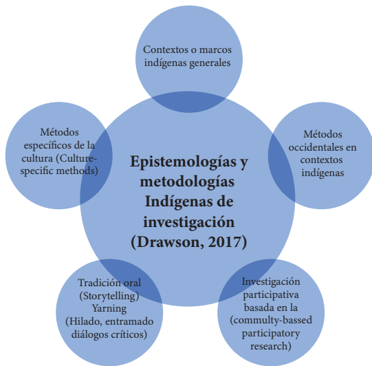
Figura 1. Boceto sobre relación entre elementos de los métodos indígenas de investigación (elaboración a partir de la propuesta de Drawson, 2017).

La confrontación entre paradigmas epistemológicos y concepciones sobre la investigación y la educación al neutralizarse a través del consenso evita la remoción ontológica y epistemológica, particularidad por la que las epistemologías y metodologías indígenas de investigación provocan un contrapunto epistémico y metodológico a través de las siguientes relaciones (Drawson, 2017):