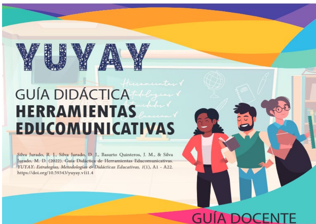
Figura 1: Portada de la Guía Didáctica de Herramientas Educomunicativas (GD)

Fuente: Silva-Jurado et al., (2022, p. A6)